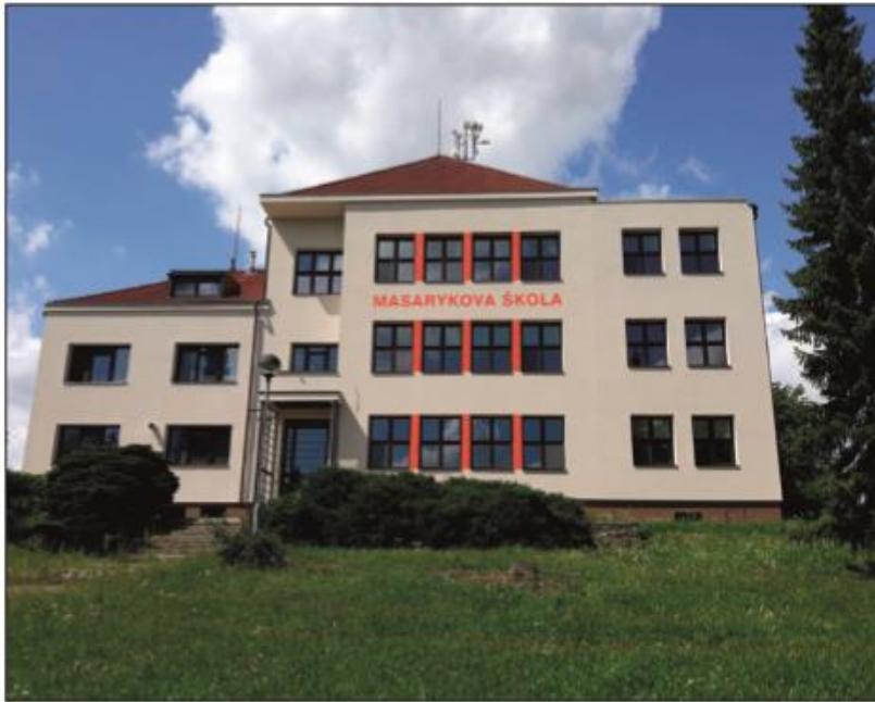
Současná podoba školy po nedávných úpravách a opravách.

1994 vedení obce zajistilo generální opravu střechy včetně klempířských prací, byly instalovány nové elektrické rozvody a na novou omítku se vrátil historicky do-ložitelný nápis Masarykova škola.