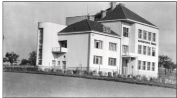
Archivní snímky nově postavené ohnišovské školy.

že dokázali prosadit realizaci díla v této podobě, na svoji dobu, a vlastně i na dnešní poměry, stále moderně působící objekt, kterému čas neubral na nadčasovosti a který stále plní své poslání – vzdělání dětí. Jak majestátně a vpravdě futuristicky musela na tehdejší obyvatele obce působit běloskvoucí novostavba vypínající se nad obcí, ve které plynul život fakticky stále ještě v rytmu počátku 20. století?