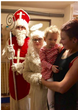
Mikuláš u Šaldu

Opět po roce, 5.prosince přišel do Bohdašína Mikuláš se svojí družinou. Letošní průvod byl o 2 čerty větší. Navštívili 6 domácností s dětmi. Všem, kteří připravili dětem tento pěkný zážitek, patří velké poděkování. Je moc dobře, že se snažíme naše pěkné tradice dodržovat a předávat příštím generacím.