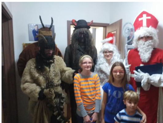
Mikulášova družina u Moravců