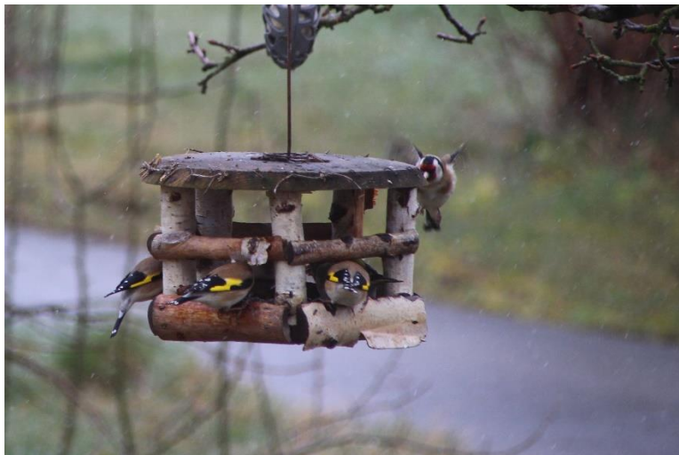
Foto – stehlíci na krmítku

absolutní nutností a podporou samého přežití, chceme-li zachovat alespoň zbývající část druhové pestrosti ptačí populace“ (str. 8), která od roku 1800 klesla hustotou osídlení ptactva o neuvěřitelných 80% (str.10). Jinak řečeno, tam, kde dřív na jednom místě zpívalo deset ptáčků, dnes štěbetají jen dva. Tento pokles dává autor za vinu několika dílčím faktorům, jejichž příčina je ale stejná – výměna trojpolního zemědělského systému plného polí, luk, vinic, sadů atd. za monokulturní lány užitkových rostlin, kde díky biocidům probíhá „holokaust pro přirozené prostředí a především výživu ptáků“ (str. 8).