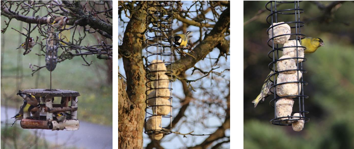
Foto zleva – stehlíci, sýkora koňadra, zvonohlík zahradní a čížek lesní

Z nejdůležitějších výsledků výzkumů autor uvádí (s pečlivým odcitováním jednotlivých studií, které zde vynechám), že „u ptáků s trvale dostupnou nabídkou potravy na krmných stanovištích [...] se výrazně zvýšily počty pozorovaných jedinců“, jedna ze studií dokazuje, že se v daném revíru během dvou let zvedl počet hnízdících párů ze 104 na 273, z čehož byl nejvýraznější příbytek u sýkory koňadry (str. 51). Další výzkumy prokazují, že jarní a letní příkrmování „uspíší zahájení snůšky“, takže mají „mladí ptáci víc času vyrůst“ a osamostatnit se před zimou, ale také „vede ke zvýšení početní velikosti snůšky až o 20%“ a zvyšuje šance na náhradní či druhé hnízdění (str. 55). Kromě toho, že celoroční příkrmování pomáhá ptáčkům zůstat při životě, zlepšuje jejich vitalitu, zdravotní stav a odolnost a snižuje celkovou úmrtnost, vede také k usídlování nové populace v krajině a jejímu zvětšování (str. 48).