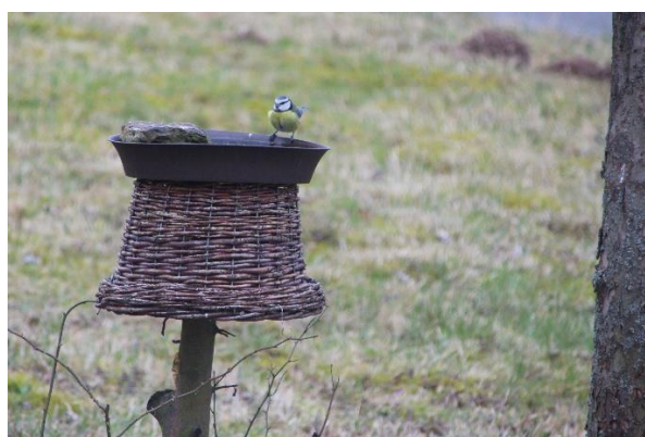
Foto zleva – vrabci a sýkory společně na krmném silu, sýkora modřinka na pítku